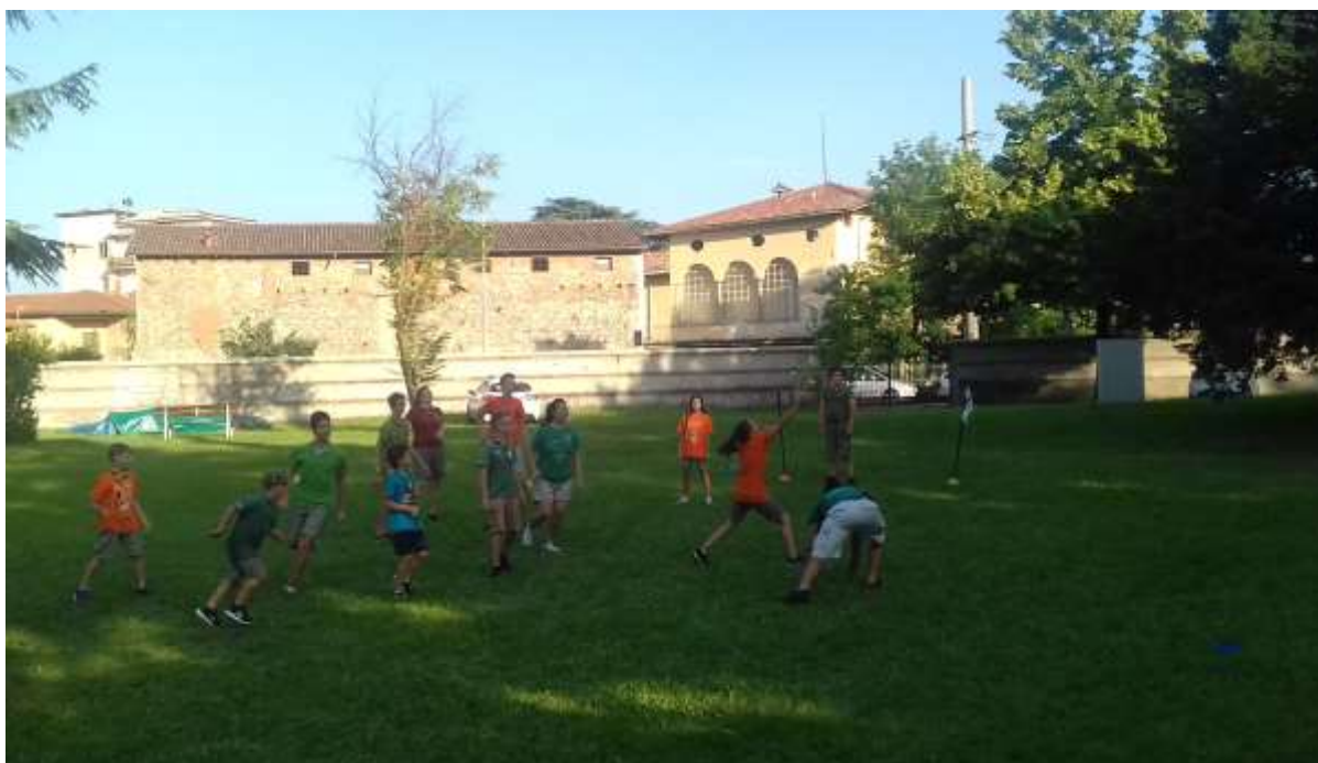
Giugno 2018 – attività al Parco Comunale di Zanica

La Sezione si presenta dunque come luogo dove i giovani possono sperimentarsi in ruolo di responsabilità e di impegno civile, di nuovo nell'ottica dei un " movimento di giovani per giovani "