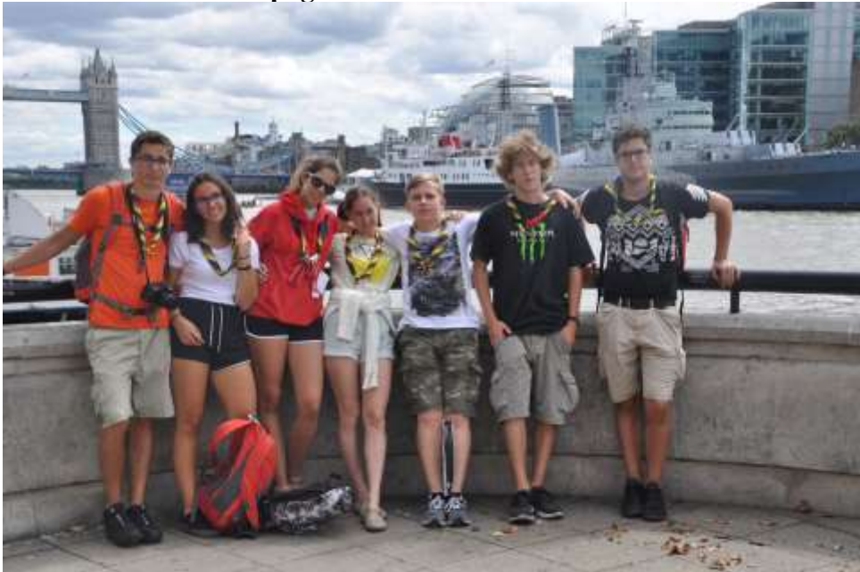
La Compagnia a Londra, agosto 2018