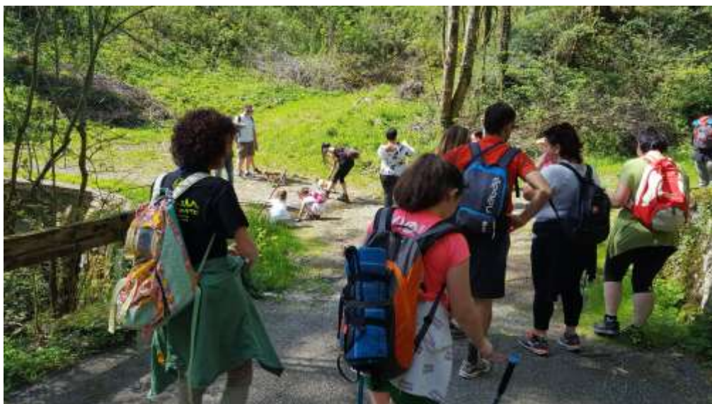
Genitori in attività : hike al campo S.Giorgio - aprile 2018

Nei confronti di questi soggetti ci configuriamo come agenzia educativa non-formale offrendo ai loro figli un percorso educativo integrato nel percorso di crescita di un/una ragazzo/a, strutturato sulle esigenze dei singoli e certificato dalle organizzazioni internazionali dello scautismo e guidismo. Offriamo loro anche tempo libero da dedicare ad altre necessità, potendo temporaneamente liberarsi della incombenza della cura della prole. Offriamo loro infine momenti di conoscenza dei valori dello scautismo e degli strumenti educativi da noi utilizzati al fine di renderli più consapevoli.