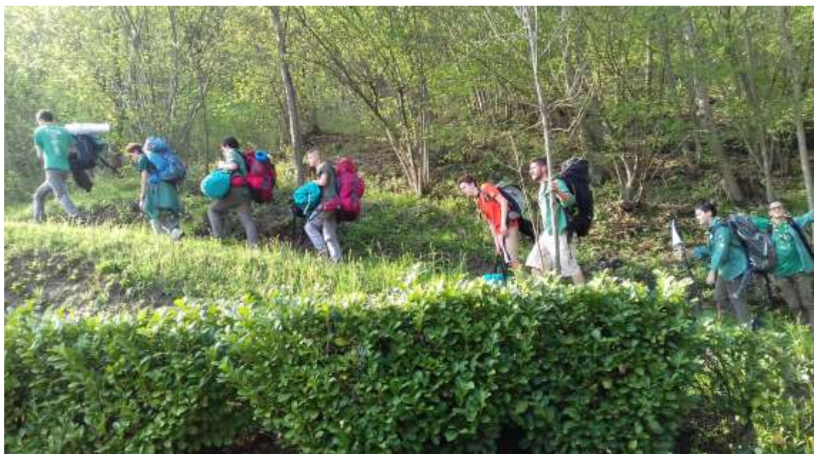
Reparto al campo S.Giorgio aprile 2018

-San Giorgio, 21/22 aprile, a Gaverina- Trade, Valle delle Sorgenti. Tema "il superamento dei limiti causati dalle nostre paure" che ha visto coinvolte le tre unità insieme nel gioco serale. Ciascuna unità ha inoltre affrontato un percorso di avvicinamento ai campi estivi. Anche al S. Giorgio sono stati invitati i Genitori, con un'attività specifica per loro (l'hike), quale seconda tappa programmata nel "progetto di sviluppo".