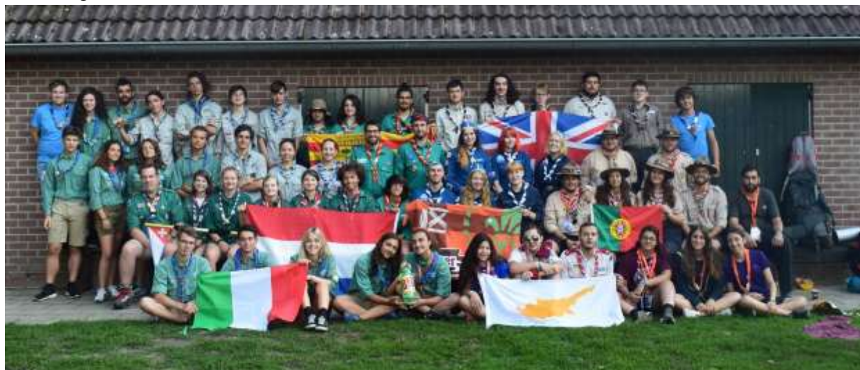
Roverway - Olanda 2018

W.A.G.G.G.S. / A.M.G.E. (World Association of Girl Guides and Girl Scout / Association Mondiale des Guides et des Éclaireuses) La più grande associazione di volontariato per ragazze e giovani donne nel mondo, oggi i 10 milioni di Guide ed Esploratrici in 144 paesi appartengono ad una comunità globale.