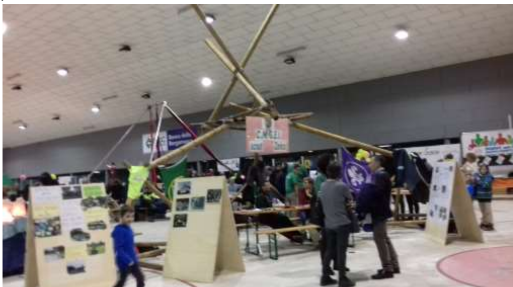
Festa per tutti – PalaZanica – dicembre 2017

-Prosegue l’uso della nostra sede da parte della locale Associazione di Aeromodellismo, per un giorno la settimana (il venerdì sera); l’Associazione ospitata contribuisce alle spese per le utenze della sede.