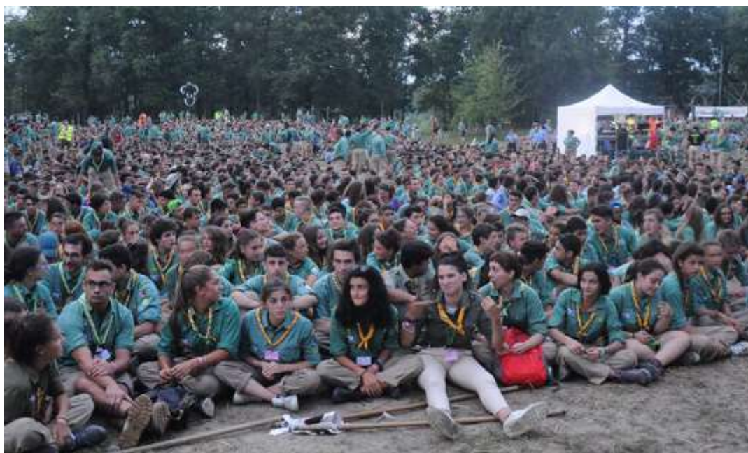
CNGEI – CAMPO NAZIONALE ESPLORATORI – AGOSTO 2018

Principi in cui si riconoscono primariamente le due Organizzazioni Mondiali WOSM (World Organization of the Scout Movement – Organizzazione Mondiale del Movimento Scout) e WAGGGS (World Organization of Girl Guides and Girl Scouts – Associazione Mondiale delle Guide e delle Esploratrici) e la Federazione Italiana dello Scouting (FIS), di cui il CNGEI è membro fondatore.