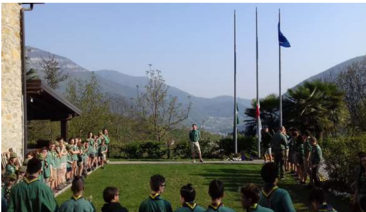
Cerimonia di apertura “campo S.Giorgio” aprile 2018

Costituisce dunque un movimento educativo scout che ha come finalità quella di contribuire alla costruzione di un mondo migliore attraverso l'educazione dei giovani. Il processo educativo è di tipo armonico e complesso, guidato dai principi dello scautismo e del guidismo internazionale (WOSM e WAGGGS).