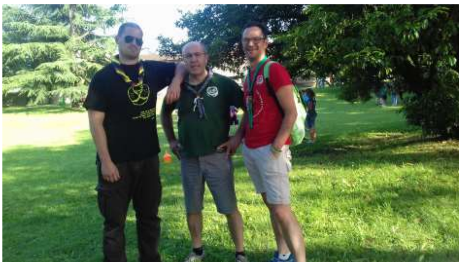
Il Capo Gruppo, il Presidente, Il Commissario della Sezione di Zanica