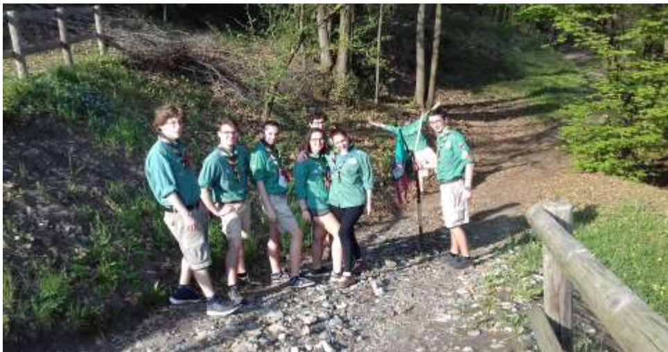
Compagnia – Campo S.Giorgio – aprile 2018

La vita a contatto con la natura favorisce anche lo sviluppo di una maturità comportamentale ambientale indispensabile per un futuro cittadino che dovrà affrontare la realtà di uno sviluppo sostenibile.