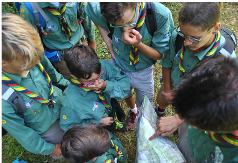
Campo estivo di Reparto 2017 - Hike di Pattuglia: si studia il percorso!