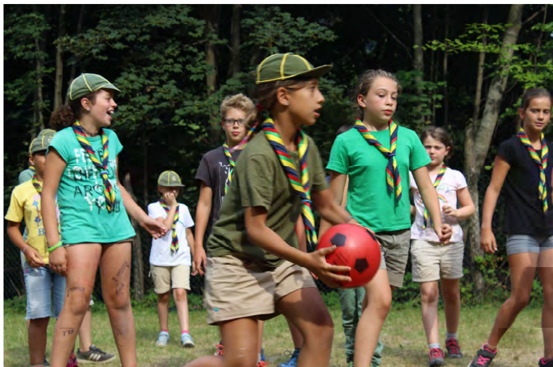
Vacanze di Branco 2017 – alla Baita - Val Trompia (Bs.)