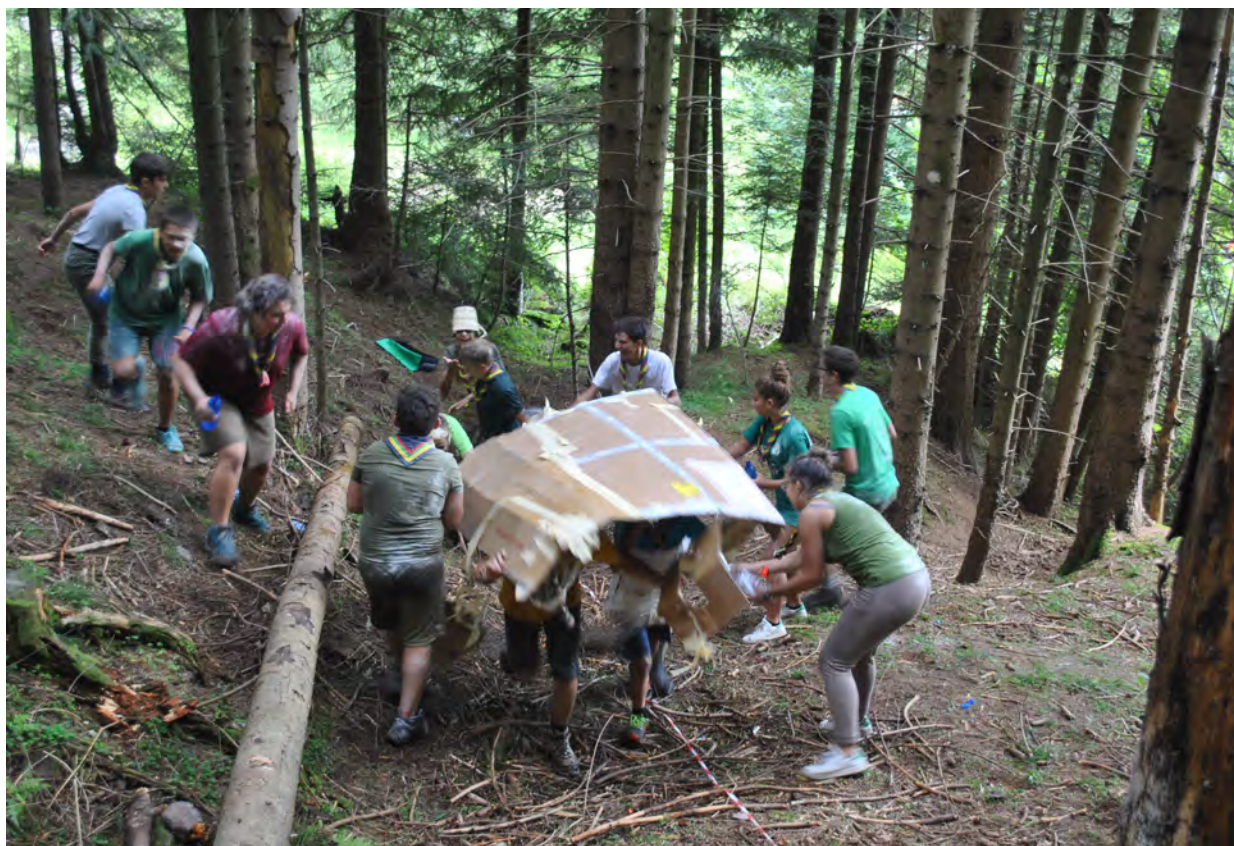
Campo estivo di Reparto – agosto 2017 - Schilpario