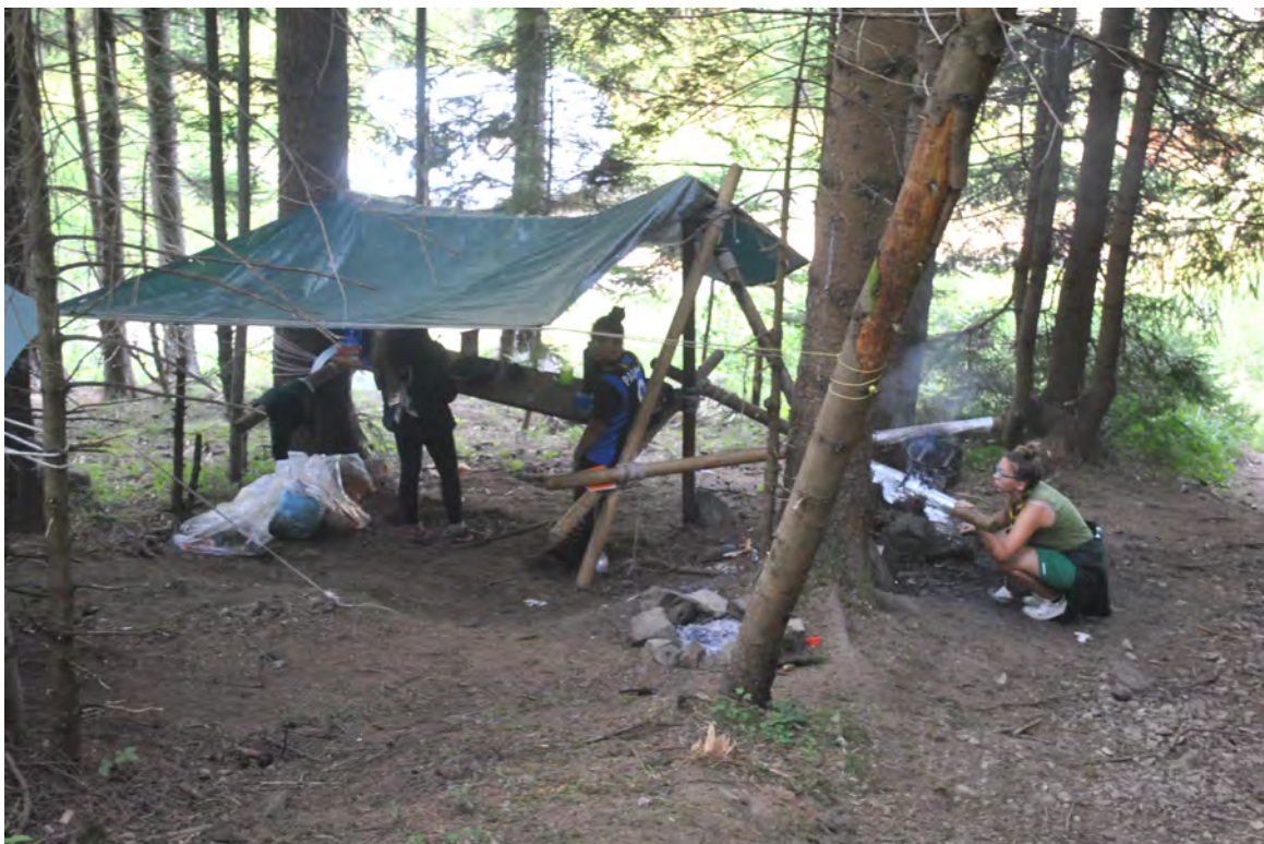
Campo Estivo di Reparto- Schilpario agosto 2017

La vita a contatto con la natura favorisce anche lo sviluppo di una maturità comportamentale ambientale indispensabile per un futuro cittadino che dovrà affrontare la realtà di uno sviluppo sostenibile.