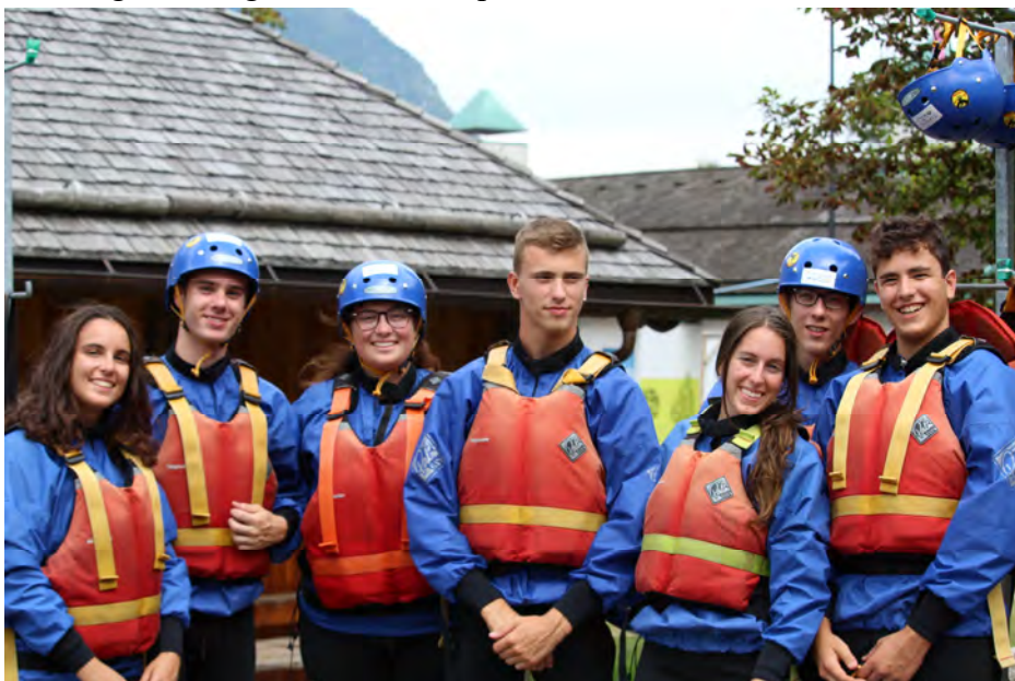
Compagnia "Ulfhedinn" Sezione di Zanica – campo estivo 2017 Val del Sole-Trentino

Unità composta da ragazzi e ragazze di età compresa fra i 16 ed i 18/19 anni, detti/e Rover.