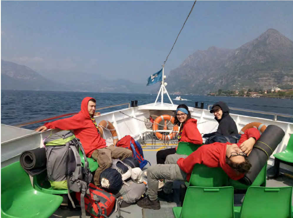
Compagnia : Pasqua Rover 2017 – Montisola