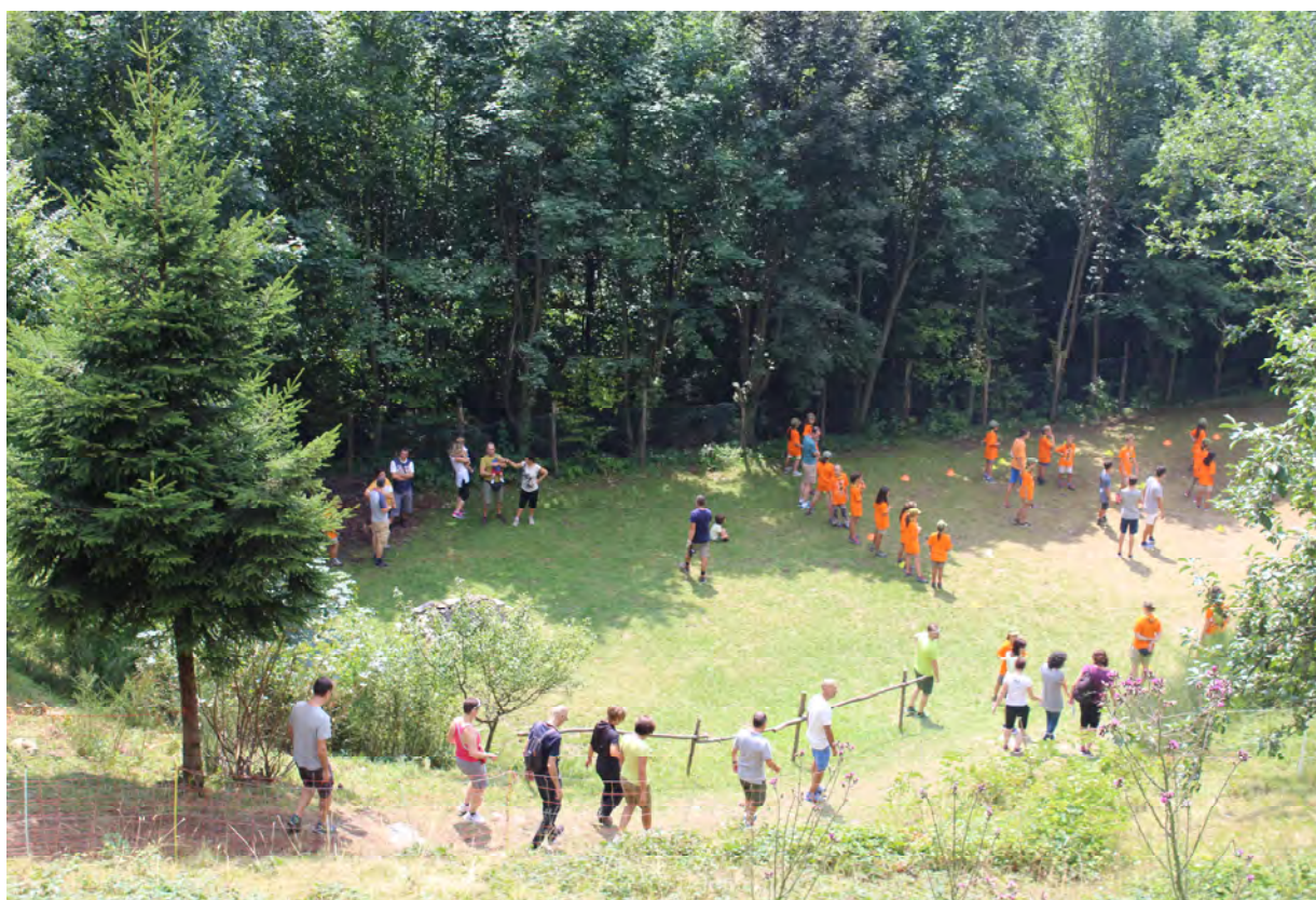
attività con i genitori alle Vacanze di Branco – luglio 2017

Nei confronti di questi soggetti ci configuriamo come agenzia educativa non-formale offrendo ai loro figli un percorso educativo integrato nel percorso di crescita di un/una ragazzo/a, strutturato sulle esigenze dei singoli e certificato dalle organizzazioni internazionali dello scautismo e guidismo. Offriamo loro anche tempo libero da dedicare ad altre necessità, potendo temporaneamente liberarsi della incombenza della cura della prole. Offriamo loro infine momenti di conoscenza dei valori dello scoutismo e degli strumenti educativi da noi utilizzati al fine di renderli più consapevoli.