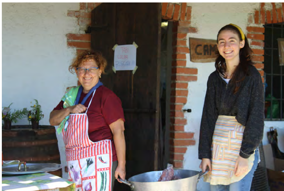
Senior in servizio al Campo Lupetti – Vacanze di Branco 2017