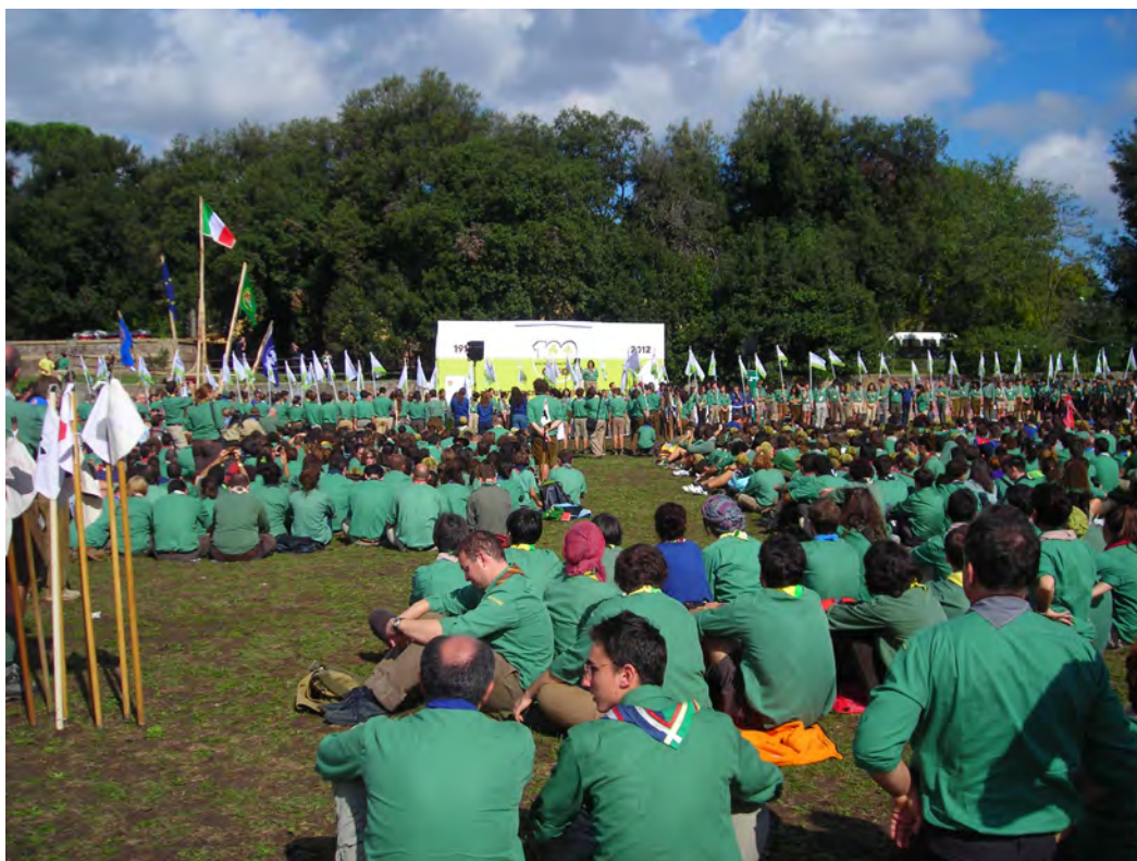
Partecipazione alla manifestazione della Festa per il Centenario del CNGEI – Roma 2012

Principi in cui si riconoscono primariamente le due Organizzazioni Mondiali WOSM (World Organization of the Scout Movement – Organizzazione Mondiale del Movimento Scout) e WAGGGS (World Organization of Girl Guides and Girl Scouts – Associazione Mondiale delle Guide e delle Esploratrici) e la Federazione Italiana dello Scouting (FIS), di cui il CNGEI è membro fondatore.