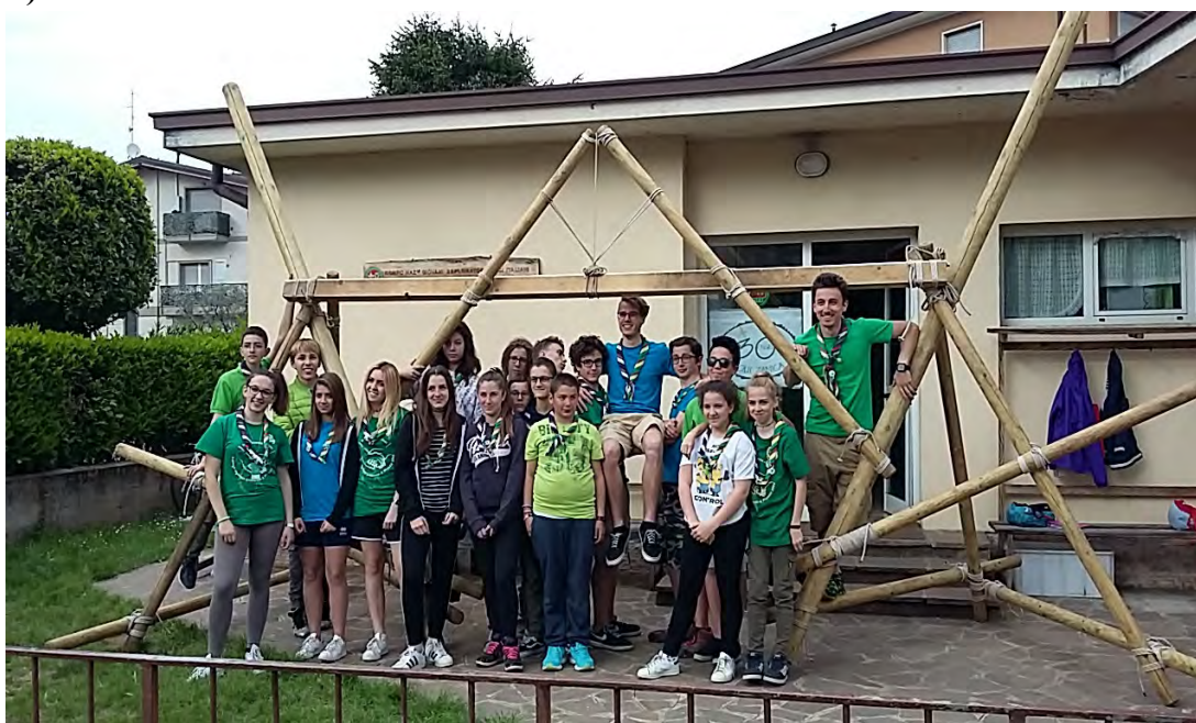
La sede della Sezione d Zanica – Il Reparto : attività di pionierismo

La sezione di Zanica ha un unico gruppo composto dal: