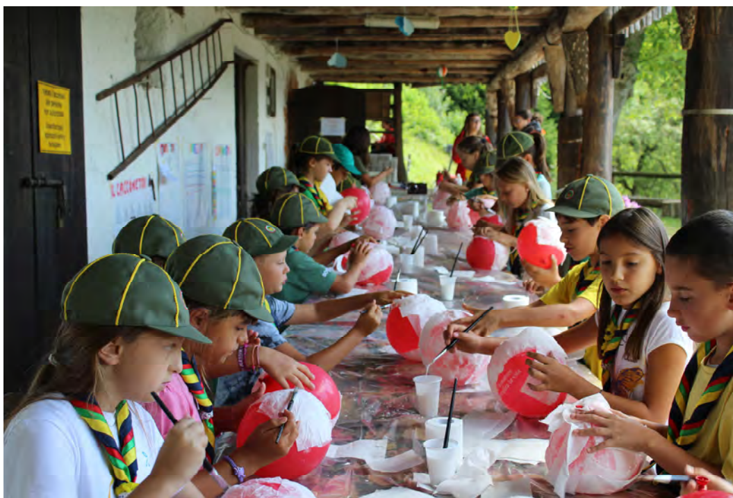
Vacanze di Branco - Val Trompia (Bs) luglio 2017

• Appartenenza a piccoli gruppi – il piccolo gruppo è l’ambiente ideale per l’integrazione del/della giovane nella vita sociale. In esso si può facilmente ottenere la completa conoscenza degli altri e la mutua considerazione all’interno del gruppo. Il piccolo gruppo permette a ognuno di comunicare, di conquistare uno spazio personale di espressione e fornisce la possibilità di esercitare una partecipazione diretta alla vita comunitaria.