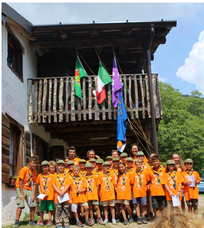
Il Branco della “Mowha” Sezione di Zanica

Unità composta da bambini e bambine di età compresa fra gli 8 e gli 11/12 anni, detti/e Lupetti/e. Di solito la numerosità di un Branco non dovrebbe superare i 30 bambini.