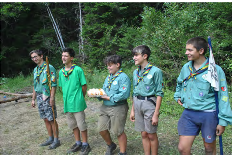
Le Pattuglie del Reparto dell'Alba, Sezione di Zanica – Campo estivo 2017 - Schilpario