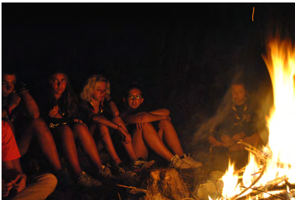
Campo estivo 2017 – Reparto – fuoco di bivacco

In particolare sono qui compresi i nostri Lupetti e Lupette , i nostri Esploratori ed Esploratrici ed i nostri e le nostre Rover .