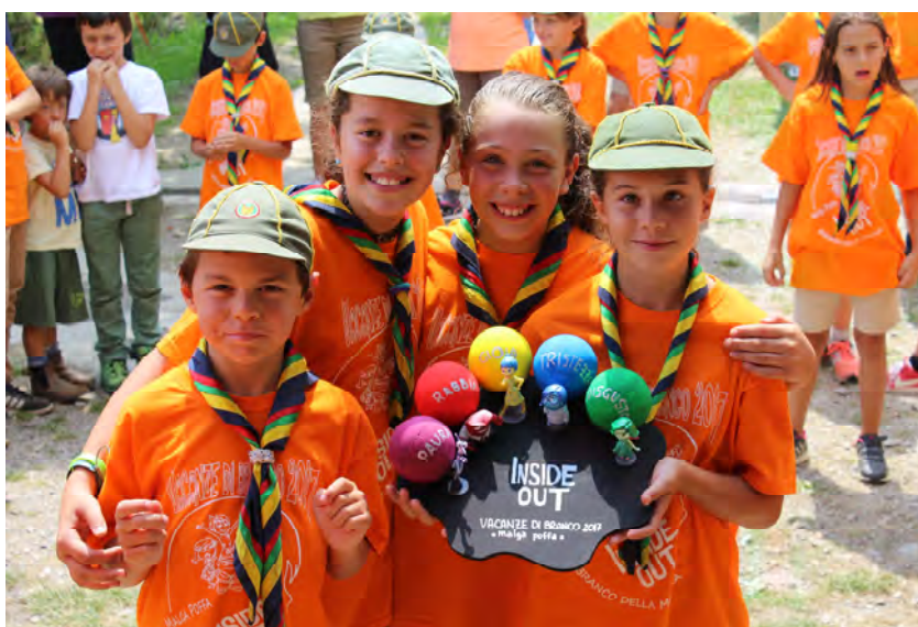
Lupetti alle Vacanze di Branco 2017

• Impegno civile , per assumersi responsabilità verso la comunità locale, nazionale e internazionale; ci impegniamo come adulti a operare in azioni di solidarietà, con impegno volontario, in difesa dei diritti, per la promozione della pace e per la tutela e valorizzazione sostenibile dell'ambiente e ad educare i giovani a questi valori.