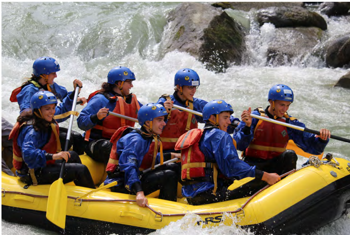
I Rover della Compagnia : attività rafting sul Noce – Val del Sole Trentino - estate 2017