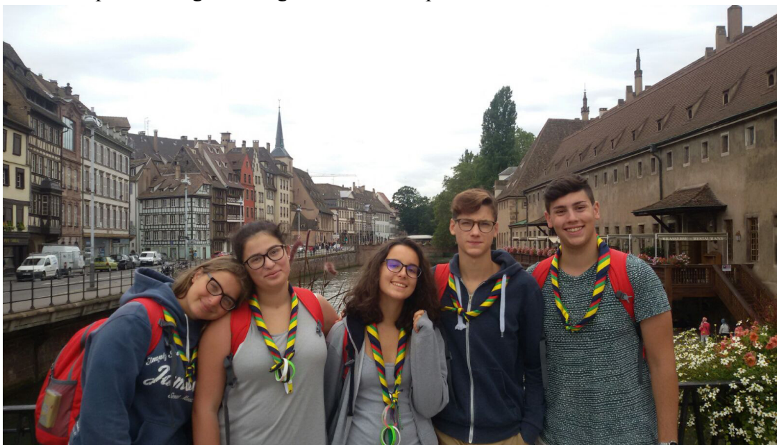
Compagnia "Ulfhedinn" Sezione di Zanica – campo estivo 2016 Strasburgo, Francia

Unità composta da ragazzi e ragazze di età compresa fra i 16 ed i 18/19 anni, detti/e Rover.