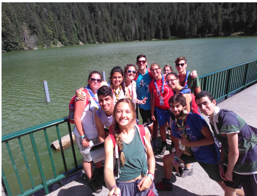
Roverway 2016 – Francia