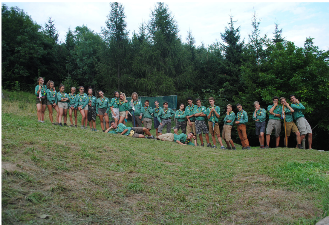
Reparto dell'Alba, Sezione di Zanica – Campo estivo 2016 – Monte Cavlera

Unità composta da adolescenti di età compresa fra i 12 ed i 15/16 anni, detti/e Esploratori/trici: un Reparto ottimale è composto da 28 giovani, suddivisi il più equamente possibile tra maschi e femmine, riuniti in piccoli gruppi (7 circa) detti Pattuglie.