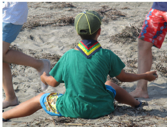
Nuovo Foulard di Gruppo