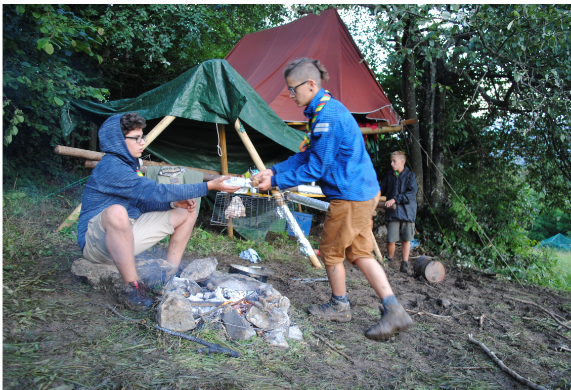
Campo estivo 2016 - Reparto

In particolare sono qui compresi i nostri Lupetti e Lupette , i nostri Esploratori ed Esploratrici ed i nostri e le nostre Rover .