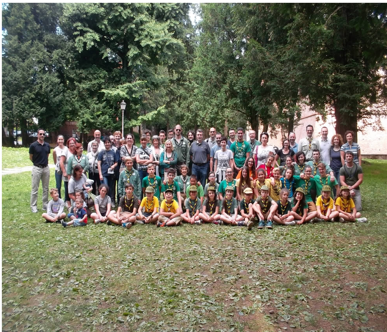
Gruppo scout Zanica - attività con i genitori- giugno 2016

Nei confronti di questi soggetti ci configuriamo come agenzia educativa non-formale offrendo ai loro figli un percorso educativo integrato nel percorso di crescita di un/una ragazzo/a, strutturato sulle esigenze dei singoli e certificato dalle organizzazioni internazionali dello scoutismo e guidismo. Offriamo loro anche tempo libero da dedicare ad altre necessità, potendo temporaneamente liberarsi della incombenza della cura della prole. Offriamo loro infine momenti di conoscenza dei valori dello scoutismo e degli strumenti educativi da noi utilizzati al fine di renderli più consapevoli.