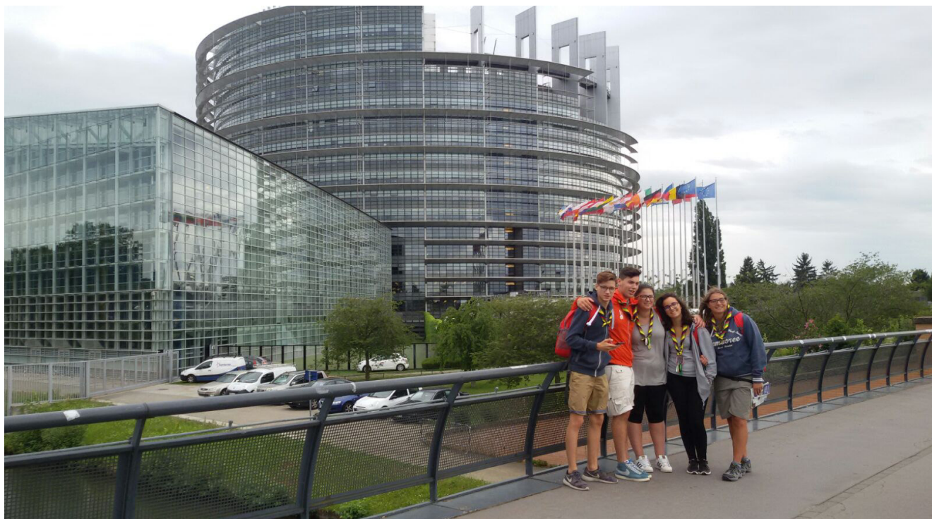
I rover della Compagnia a Strasburgo – estate 2016