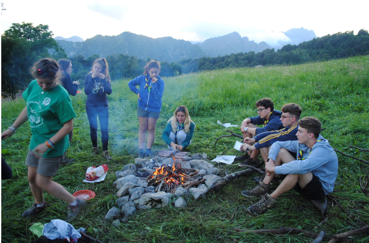
Campo Estivo di Reparto 2016

La vita a contatto con la natura favorisce anche lo sviluppo di una maturità comportamentale ambientale indispensabile per un futuro cittadino che dovrà affrontare la realtà di uno sviluppo sostenibile.