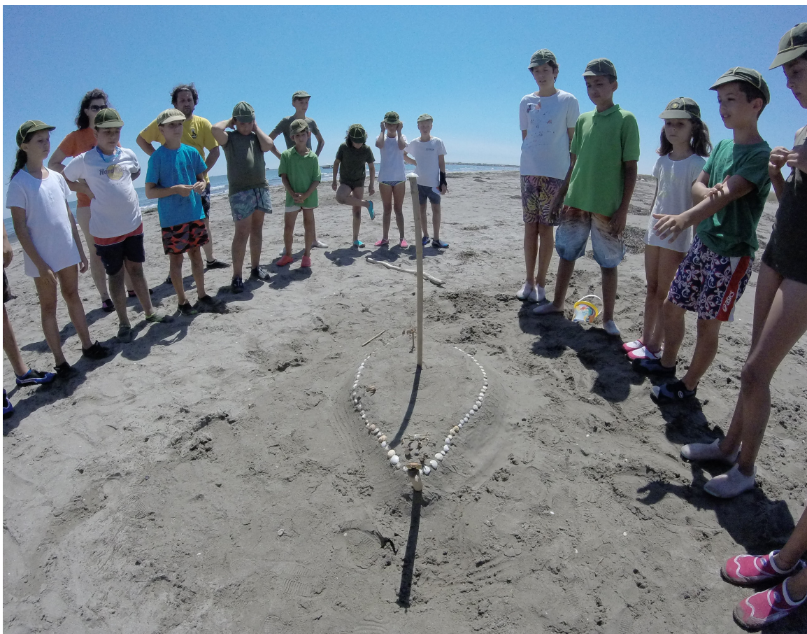
Vacanze di Branco 2016 – a Ca' Roman (Venezia)