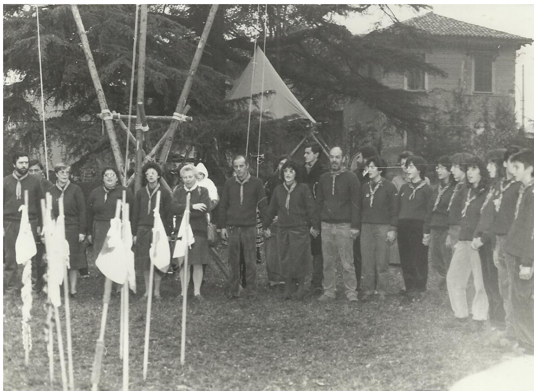
FESTA INAUGURAZIONE SEDE SCOUT- PARCO COMUNE ZANICA - 1986