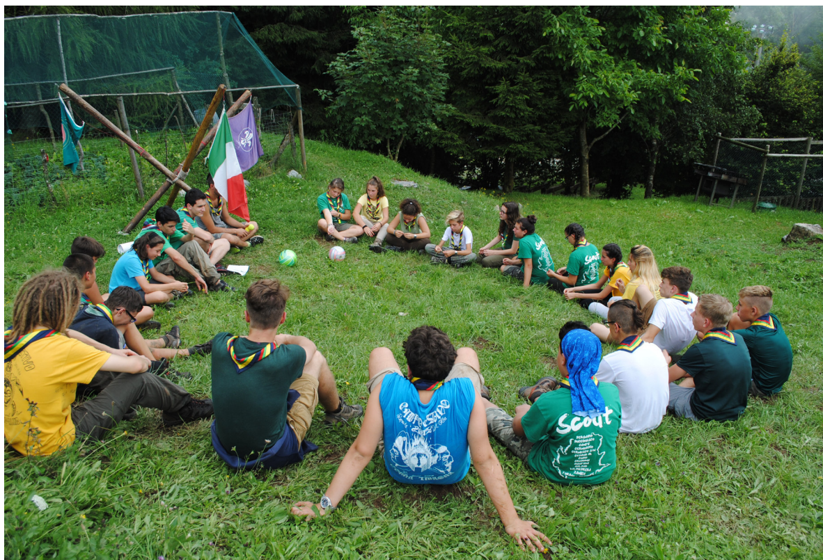
Campo estivo 2016 – Monte Cavlera - Vertova